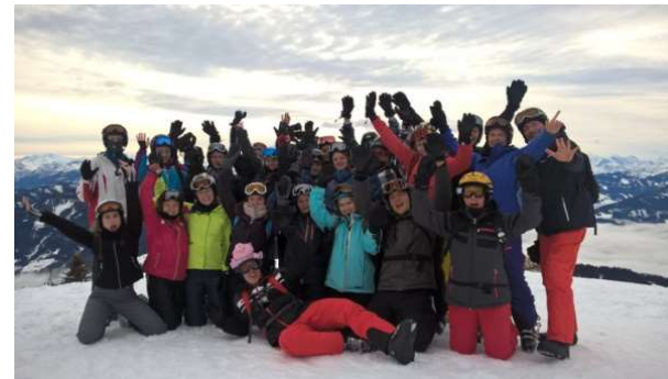
Ski-Lehrgang in der EF