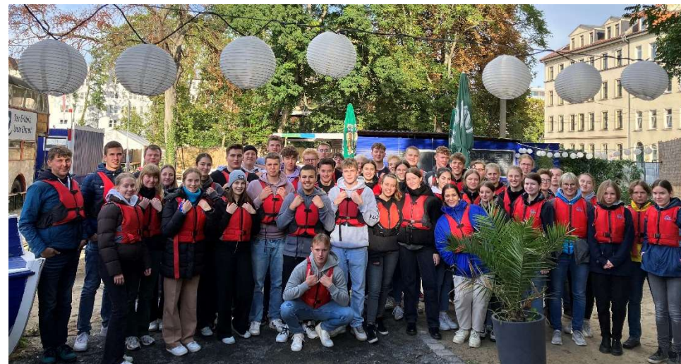
Große Abschlussfahrt nach Leipzig (Q2)