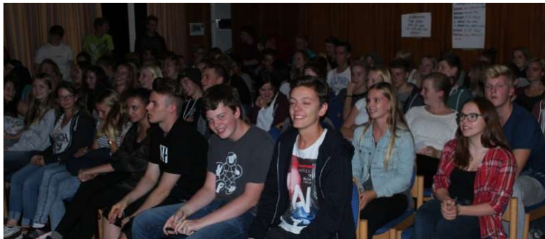
Orientierungstage zu Beginn der EF in Tecklenburg