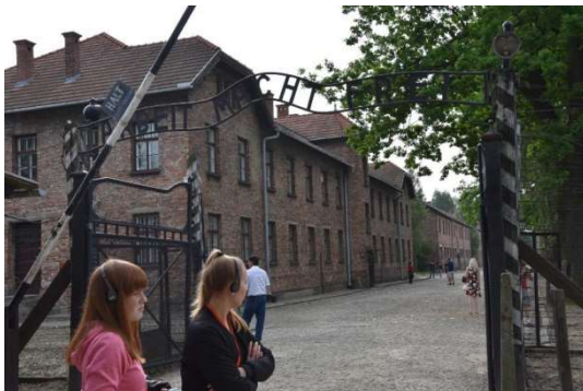
Studienfahrt Auschwitz (Q1, freiwillig)